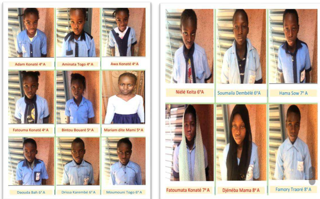
Dit zijn de 37 kanjers die gesponsord worden vanuit het project.