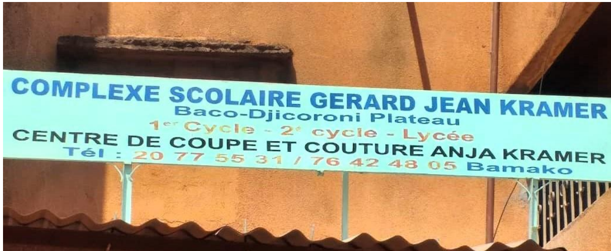
Uithangbord van het scholencomplex 'Complexe Scolaire Gérard Jean Kramer)

Voor mij persoonlijk was het hoogtepunt in 2023 mijn bezoek aan de scholen in Bamako afgelopen februari. Eindelijk was dit na vier jaar weer mogelijk. Het vergde wat voorbereiding en ik vond het ook erg spannend om te gaan. Eenmaal daar aangekomen kwam ik in een warm bad terecht en was het geweldig om iedereen na weer te zien, de scholen te bezoeken en natuurlijk het Centre de Coupe et Couture Anja Kramer welke in september 2021 is opgericht.